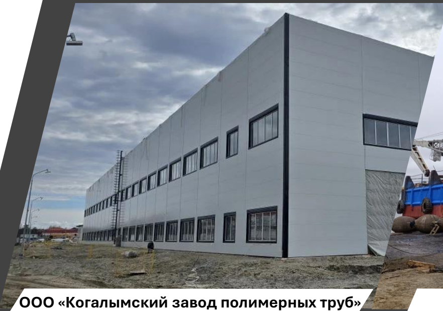
ООО «Когалымский завод полимерных труб»