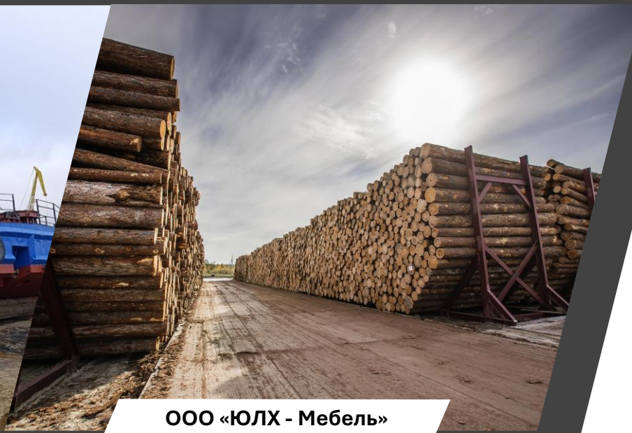
ООО «ЮЛХ - Мебель»