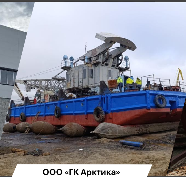
ООО «ГК Арктика»